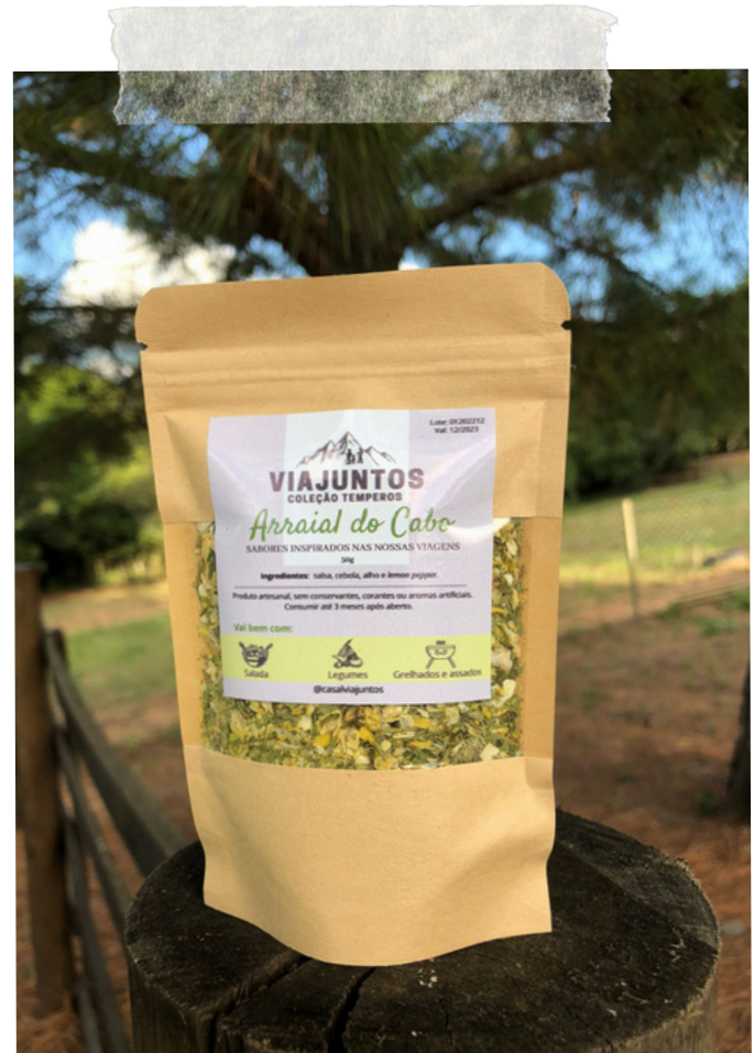
Arraial do cabo - 50g Ingredientes: Salsa, cebola, alho e lemon pepper.