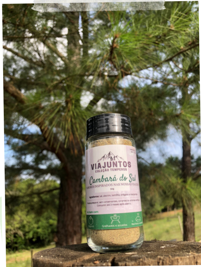
Encantos de Cidreira - 50g Ingredientes: Lemon pepper, alecrim, tomilho e hortelã.