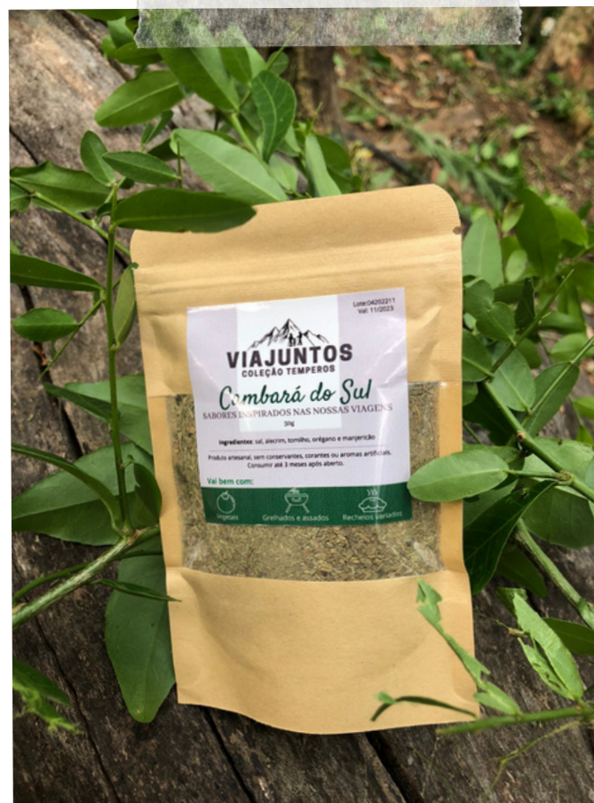
Cambará do Sul - 50g Ingredientes: Sal, alecrim, tomilho, orégano e manjeriçã.