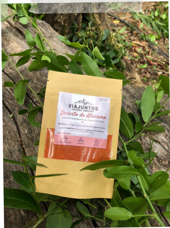
Deserto do Atacama - 50g Ingredientes: sal, páprica defumada, orégano, lemon pepper e cominho.