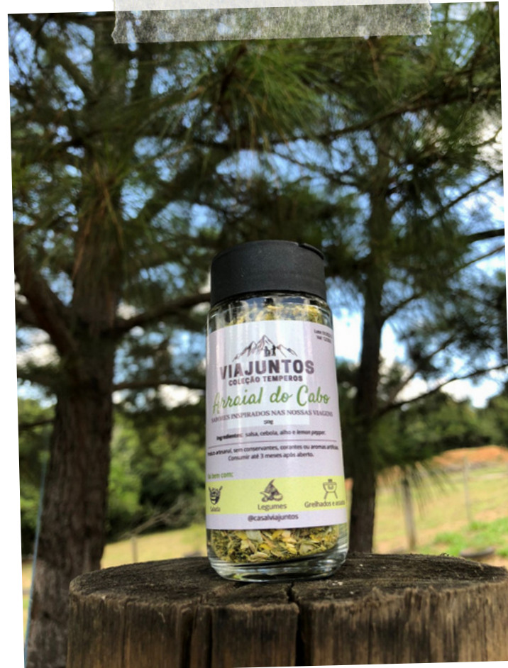
Arraial do cabo - 50g Ingredientes: Salsa, cebola, alho e lemon pepper.