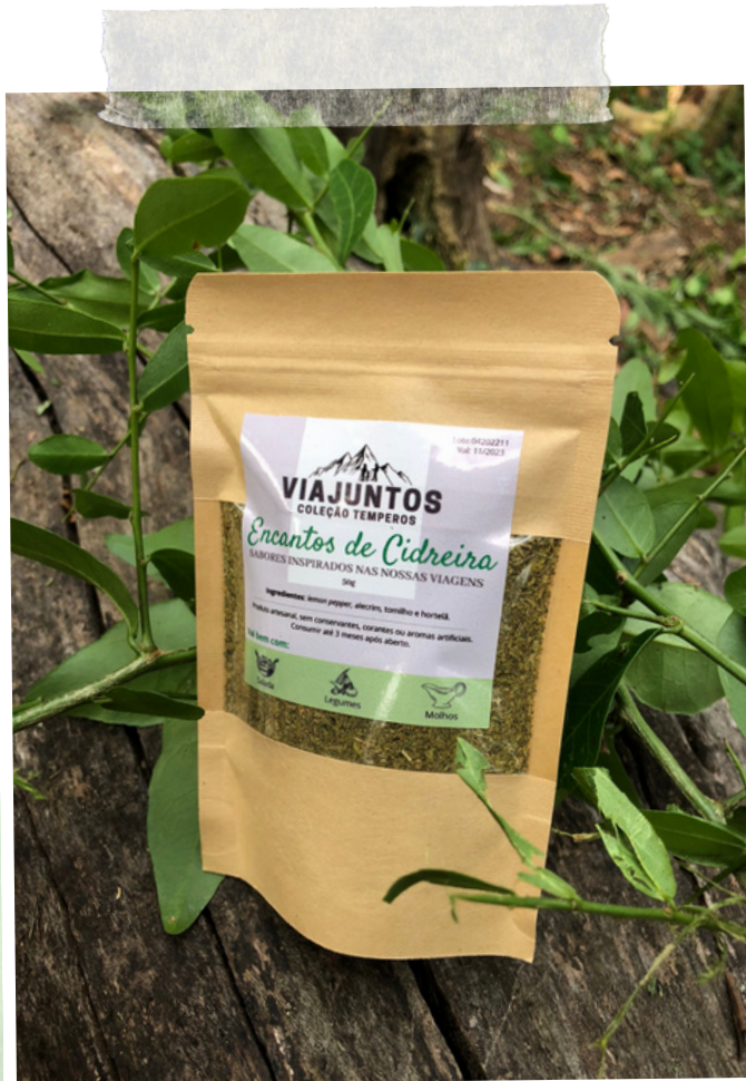
Encantos de Cidreira - 50g Ingredientes: Lemon pepper, alecrim, tomilho e hortelã.